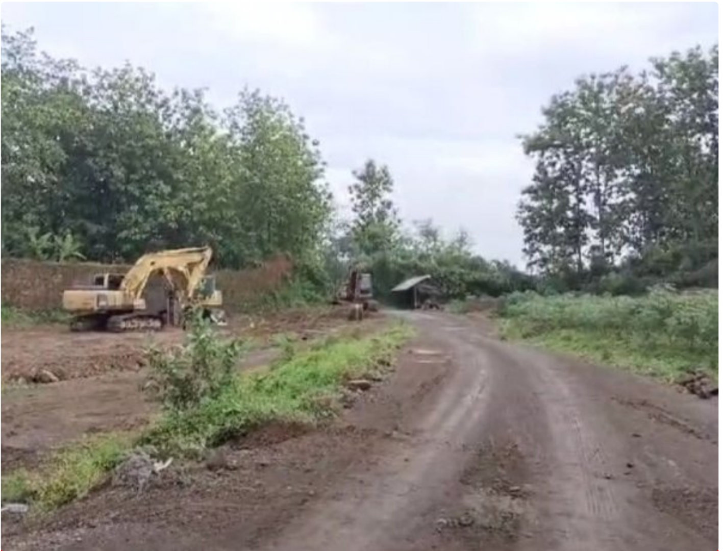
Foto: Tambang galian C di Desa Sumbermulyo, Kecamatan Tlogowungu, Kabupaten Pati, Jawa Tengah.

PATI - Cabang Dinas ESDM Wilayah Kendeng Muria kembali menjadi sorotan. Tambang galian C di Desa Sumbermulyo, Kecamatan Tlogowungu, diduga